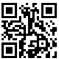
Site officiel Intramuros

Le site Intramuros : https://appli-intramuros.fr/ et les liens ci-dessus via un QR-CODE (facile à utiliser, avec un smartphone, faire une photo de l'image suivante ou avec une application, et le lien est créé sans le taper) :