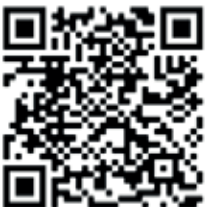
Appli pour iPhone