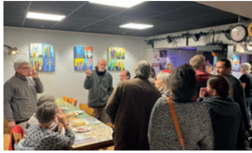
Vernissage de l'exposition Frablo

La nouvelle saison s'est ouverte avec un éclairage led (réglables en couleurs et en intensité) en remplacement des vieux néons obsolètes, et également l'installation de spots orientables pour mettre en valeur les expositions. Un grand merci à la municipalité pour cet investissement qui complète le remplacement du frigo l'an dernier.